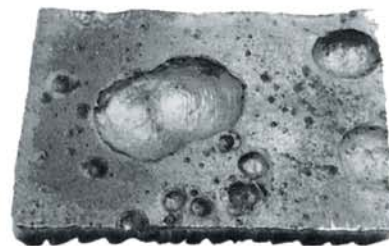
Corrosie veroorzaakt door sulfaat reducerende bacteriën.